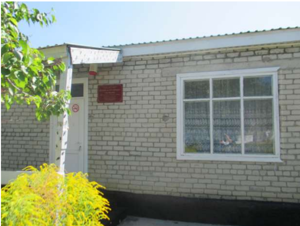
Фото центрального входа в здание ДОУ